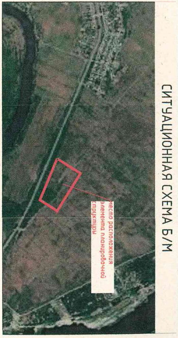
СИТУАЦИОННАЯ СХЕМА Б/М